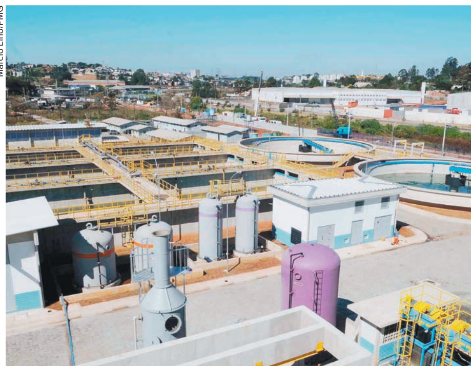
Estação de Tratamento de Esgoto (ETE) de Bonsucesso, que atenderia 260 mil pessoas